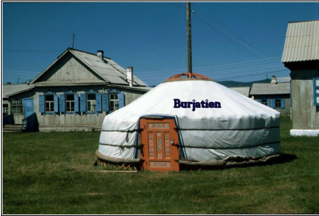
Mongolische Jurte in einem Vorort von Ulan Ude