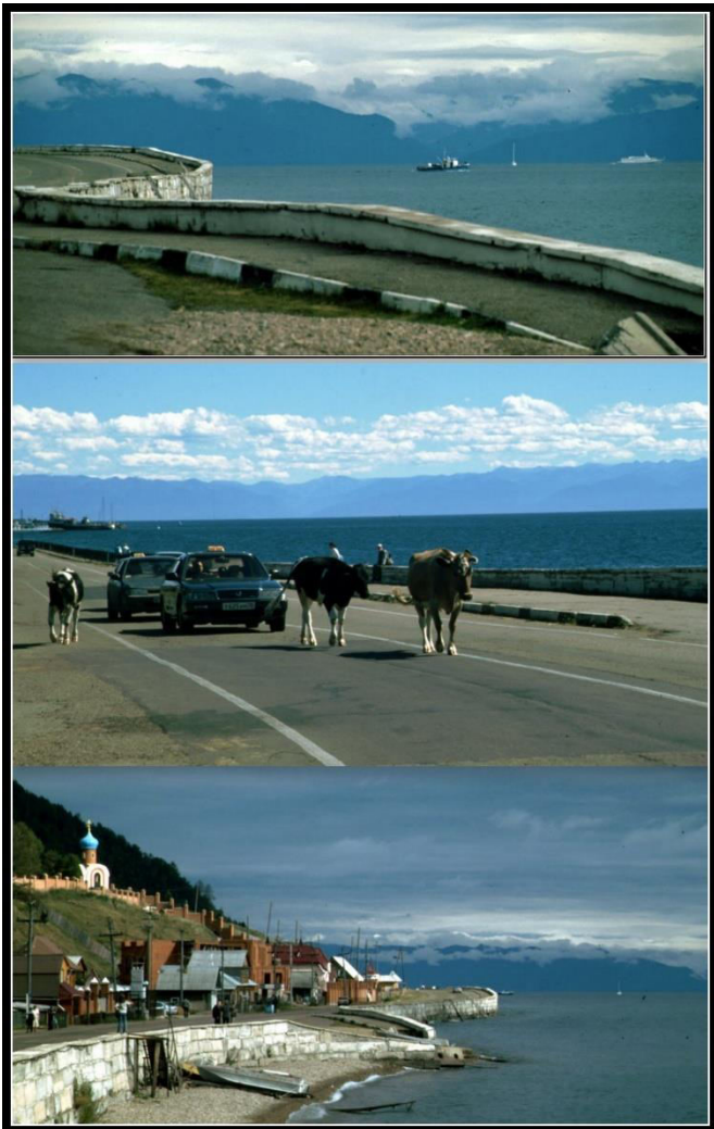
Listwjanka am Baikalsee