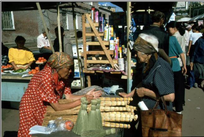
Auf dem Wochenmarkt von Ulan Ude